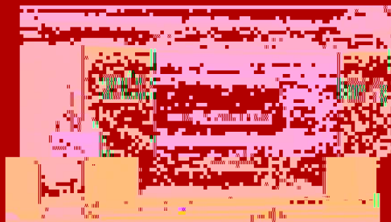
各系部主任主持各自系部的年度学术交流会

会议第三阶段由各系部主任主持，分别就各自系部的年度工作总结和下一年度工作计划进行了汇报。第四阶段的会议由各系部主任主持，就各自系部的年度工作总结和下一年度工作计划进行了汇报。